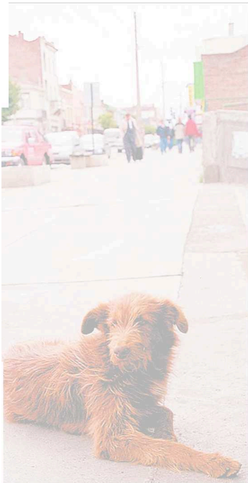
LA PRENSA AUSTRAL