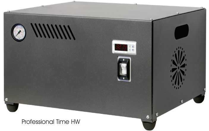
Professional Time HW

Il drenaggio a recupero interno BPS evita gli sprechi d'acqua e consente un migliore raffreddamento del gruppo pompante. Sistemi di ottima qualità e alta tecnologia a prezzi competitivi .