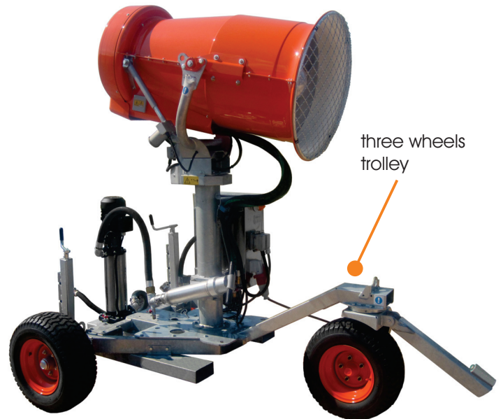
three wheels trolley