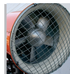
Ventilatore. High power ventilator view of the A-60 fog cannon.