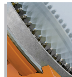
Anello ugelli. Apache A-60 industrial ventilator head view with detail of the three sectors single nozzle ring.